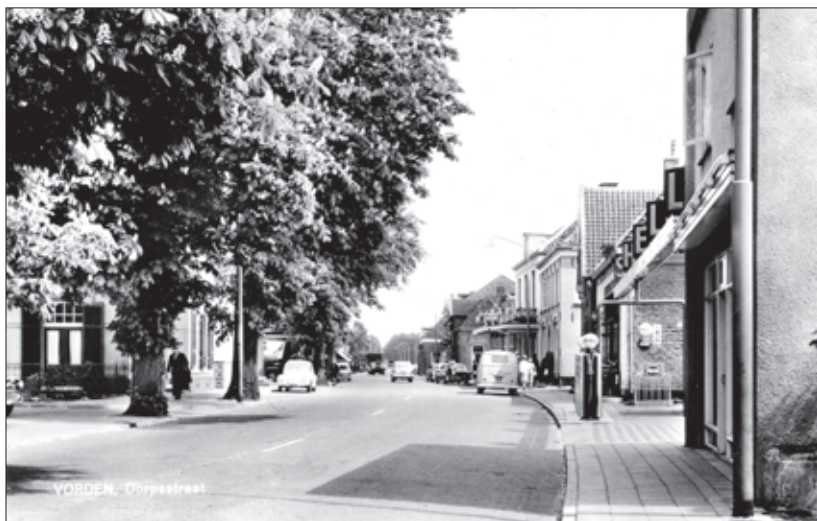
De Dorpsstraat in de jaren 60 van de vorige eeuw, zoals afgebeeld op een oude ansichtkaart. De benzinepomp rechts op de foto hoorde bij Garage Kuypers. Nu vinden we op die plek de supermarkt van Grotenhuijs (Super De Boer).