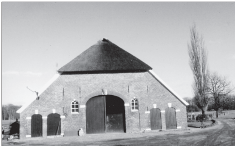
Boerderij Tjoonk, in Hackfort

Eén van de mooiste boerderijen op het landgoed Hackfort is wel de bijzonder weids in het landschap gelegen boerderij Tjoonk. De boerderij is, blijkens de muurankers, gebouwd in 1816, of heeft althans in dat jaar grotendeels haar huidige uiterlijk verkregen. Een opmerkelijk bouwkundig element van de boerderij wordt gevormd door de sluitsteen boven de deeldeuren.