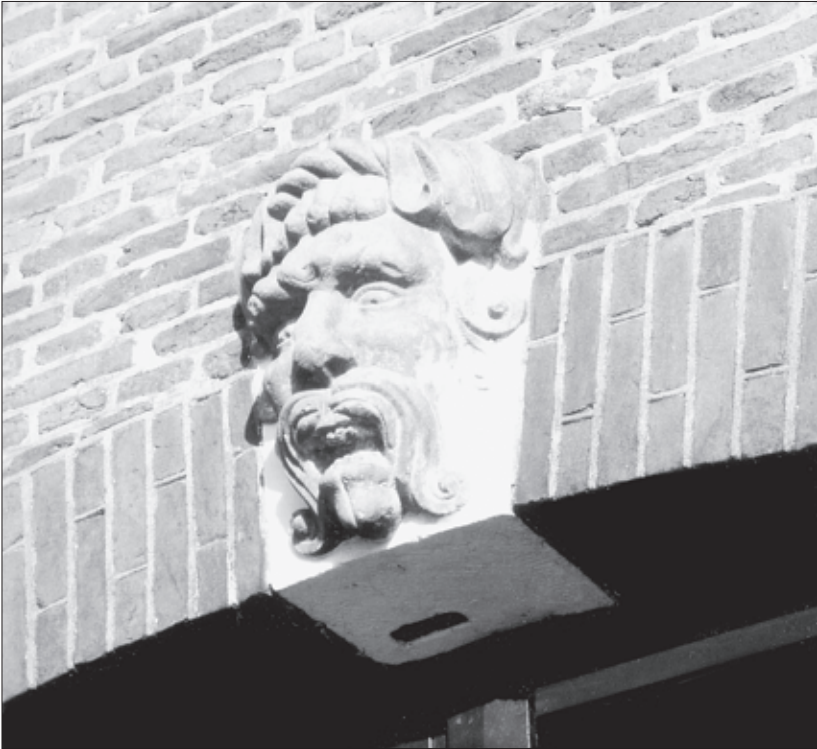
De sluitsteen in de vorm van een renaissancemasker boven de deeldeuren van boerderij Tjoonk,

In 1788 huwde Borchard Willem Frederik van Westerholt van Hackfort met zijn volle nicht Wilhelmina van Heeckeren van Enghuizen. Zij waren beiden op dat moment 22 jaar oud. Het jeugdige echtpaar zal zich een modern huis gewenst hebben en zo vond in 1788 een grootscheepse verbouwing plaats, waarbij het poortgebouw werd afgebroken. De sluitsteen zal wegens zijn fraaie afwerking zuinig bewaard zijn gebleven.